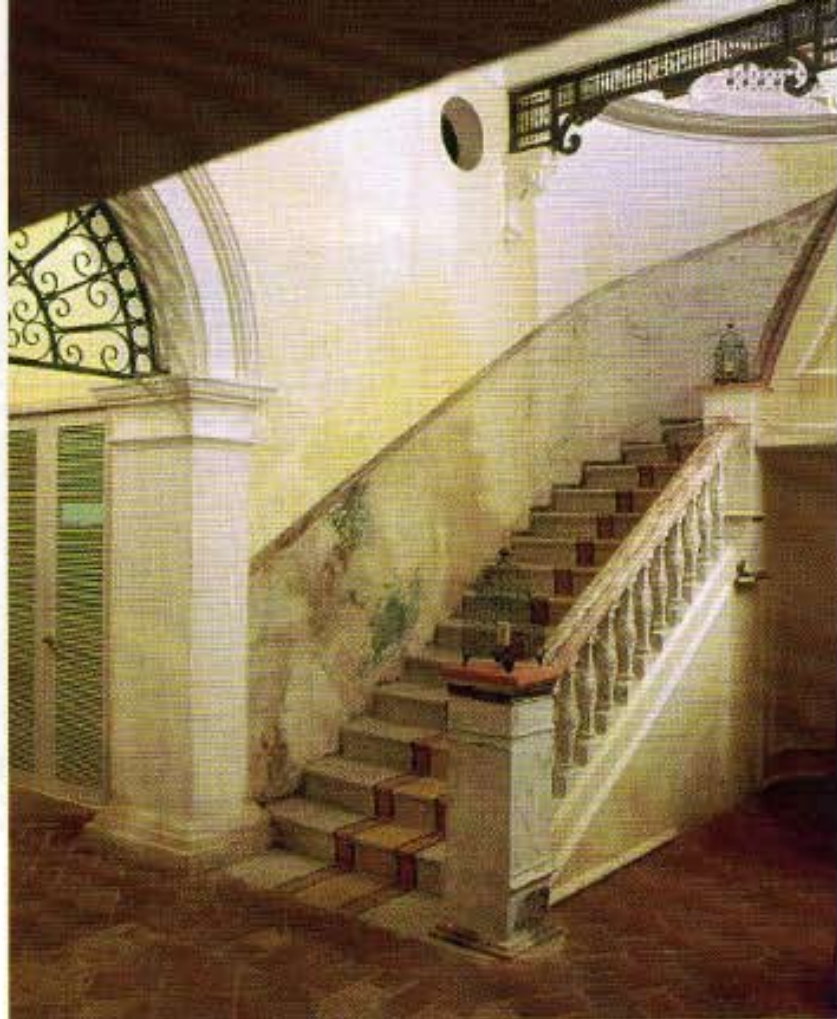
Escalera principal en espiral de estilo republicano con peldaños de granito.