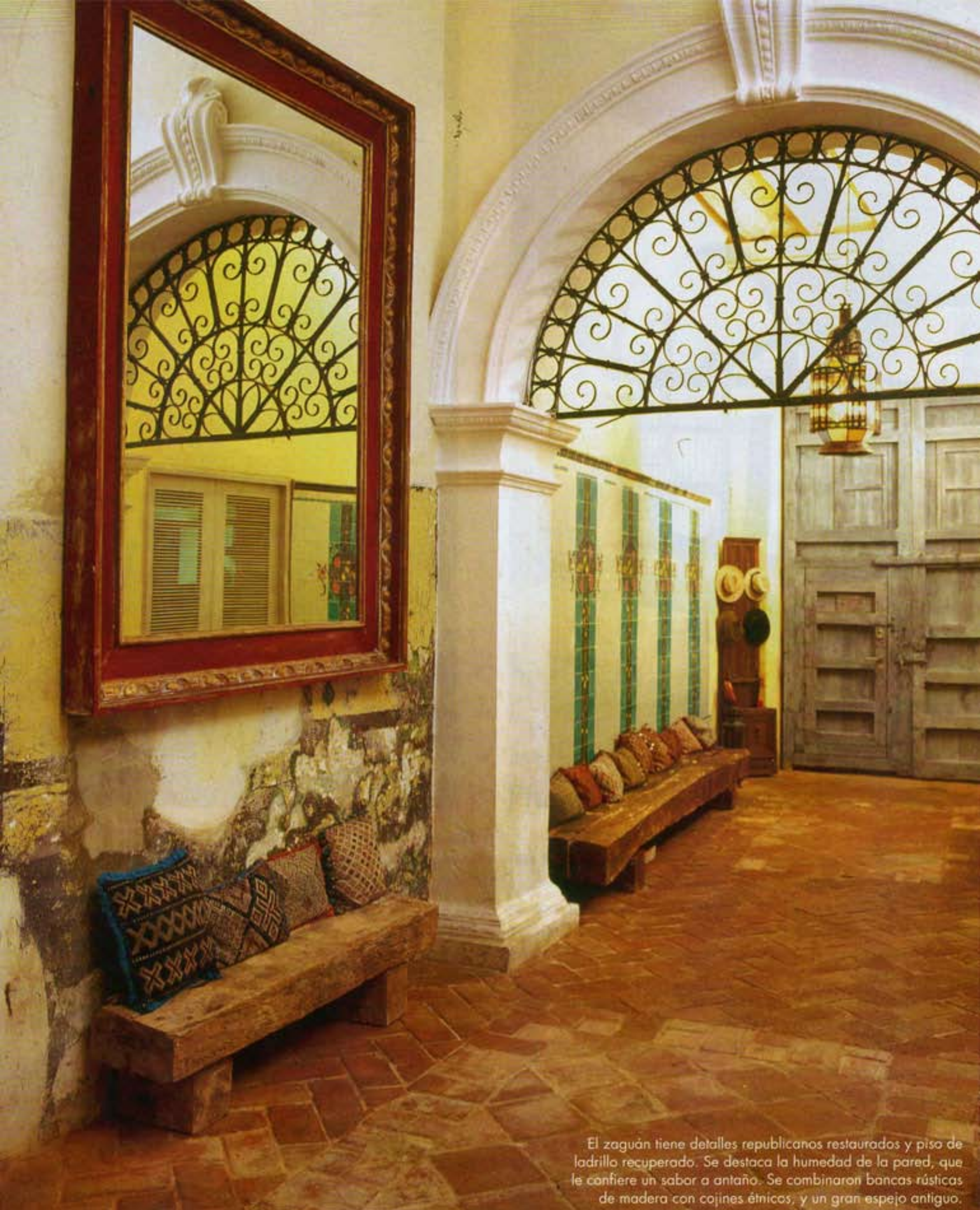
El zaguán tiene detalles republicanos restaurados y piso de ladrillo recuperado. Se destaca la humedad de la pared, que le confiere un sabor a antaño. Se combinaron bancas rústicas de madera con cojines étnicos, y un gran espejo antiguo.